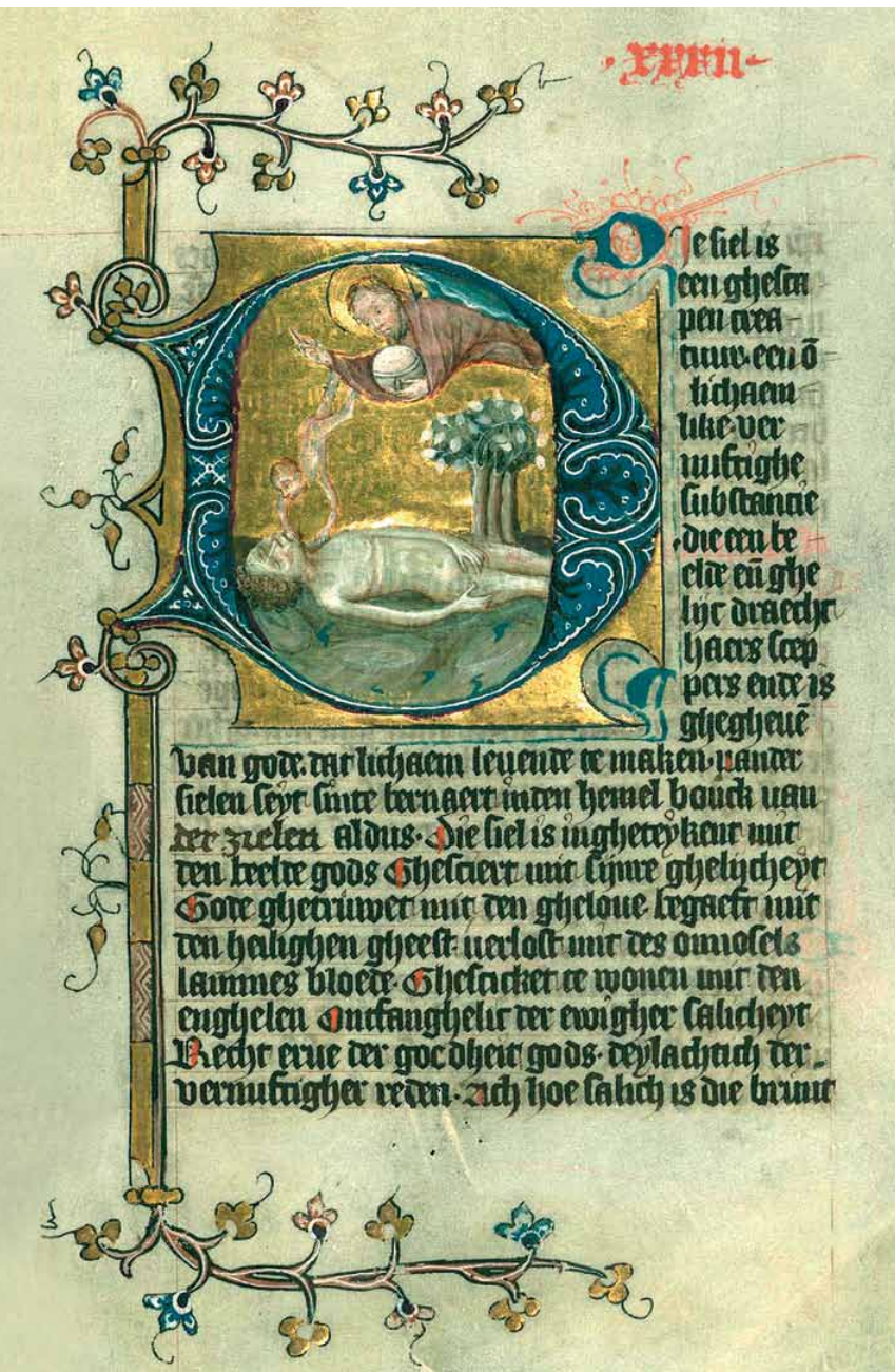
«Gott, der HERR, blies dem Menschen den Odem des Lebens in seine Nase.» Dirc van Delft, Walters Manuscripts W171, um 1400, Wikimedia