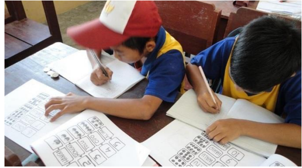
... führt zu Erfolg in der Schule