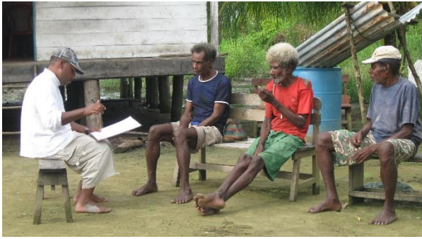
Spracherkundung und -planung ...