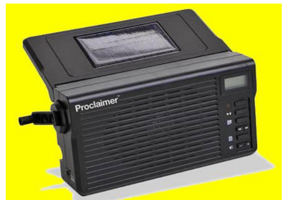
Solarbetriebener MP3-Player für Hörbibeln, dem Gruppen von 20, 30 oder mehr Leuten zuhören können

Im afrikanischen Kontext ist es allerdings auch wichtig, dass das übersetzte Wort Gottes nicht nur in Buchform veröffentlicht wird. Denn während das Schulniveau im Durchschnitt zwar gestiegen ist, sind die Völker Nigerias doch grundlegend geprägt von einer mündlichen Kultur, in der das Lesen keinen hohen Stellenwert hat. Viele Menschen können nicht lesen, sind dafür trainiert, grosse Mengen an Informationen übers Hören